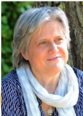
Coach Consultante RH