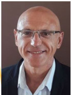
Coach Consultant RH