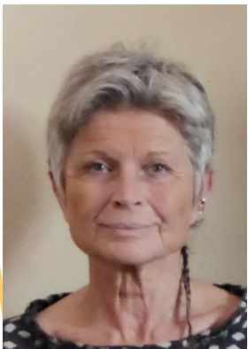
Coach Consultante RH