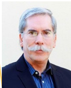
Coach Consultant RH